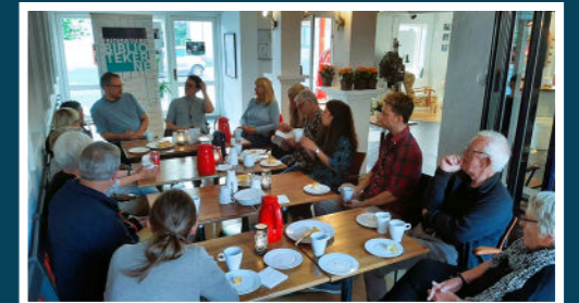
Organiseret vildskab i Skibby Kino.