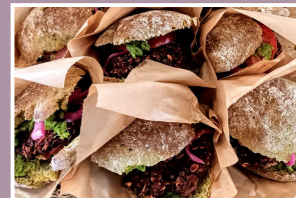
Klimavenlige burgere til fællesspisning i bæredygtighedsugen. Lavet af elever fra udskolingen.