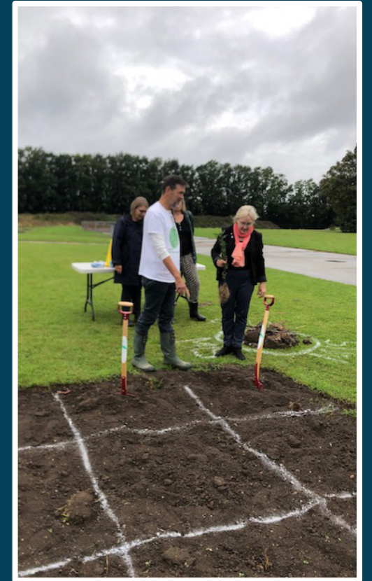
Borgmesteren i Frederikssund planter det første træ