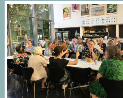
Fællesspisning Willumsens Museum, Foto: Falkenstjerne Fælles.

er en forening, der har til formål at skabe lokalt netværk for omstillingsinteresserede folk og familier. Foreningen ønsker at hjælpe folk til at finde grønne ligesindede der hvor du bor og få endnu flere bæredygtige aktiviteter ud i lokalsamfundet.