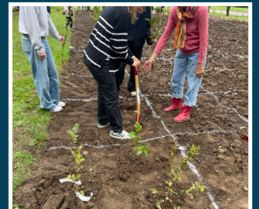
Unge fra Frederikssund Gymnasium planter træer med hjælp fra frivillig i Grønne Nabofællesskaber.