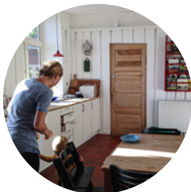
Køkken i privat bolig