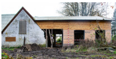
Loen ombygges og udvides, så der bliver plads til, at hele fællesskabet kan mødes og spise sammen.

Bofællesskabet stod færdigt i 2018 og består af 90 arkitekttegnede økologiske og åndbare huse, der ligger forskudt i rækker over for hinanden placeret i klynger med forskellige ejerformer. Boligområdet er lagt i byzone og er organiseret som en forening, der indeholder en privat grundejerforening, en andelsboligforening og en almen boligafdeling. Der er 44 almene boliger, 23 privatejede og 23 andelsboliger. Den oprindelige gård og en ombygget lo fungerer som fælleshuse.