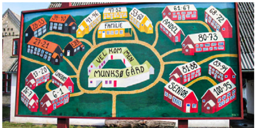
Fotoet viser et malet oversigtsbillede over de forskellige typer af klynger, der er i Munksøgård. Skiltet er det første, man møder, når man ankommer. Det er sat op lige foran den fælles gård, som danner centrum for bofællesskabet med forskellige fællesfaciliteter.

Et eksempel herpå er Munksøgård fra 2000, hvor der er fem klynger med 20 boliger og fælleshus i hver klynge.