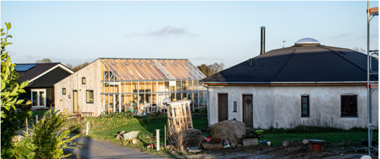
I Frikøbing har man en blanding af selv-byggede huse, f.eks. første hus til højre, som er et ottekantet halmballehus, arki-tekttegnede huse, f.eks. huset i midten tegnet af Sigurd Larsen, og typehuse, hvor beboerne selv har kunnet vælge bæredygtige materialer, rumfordeling mv.