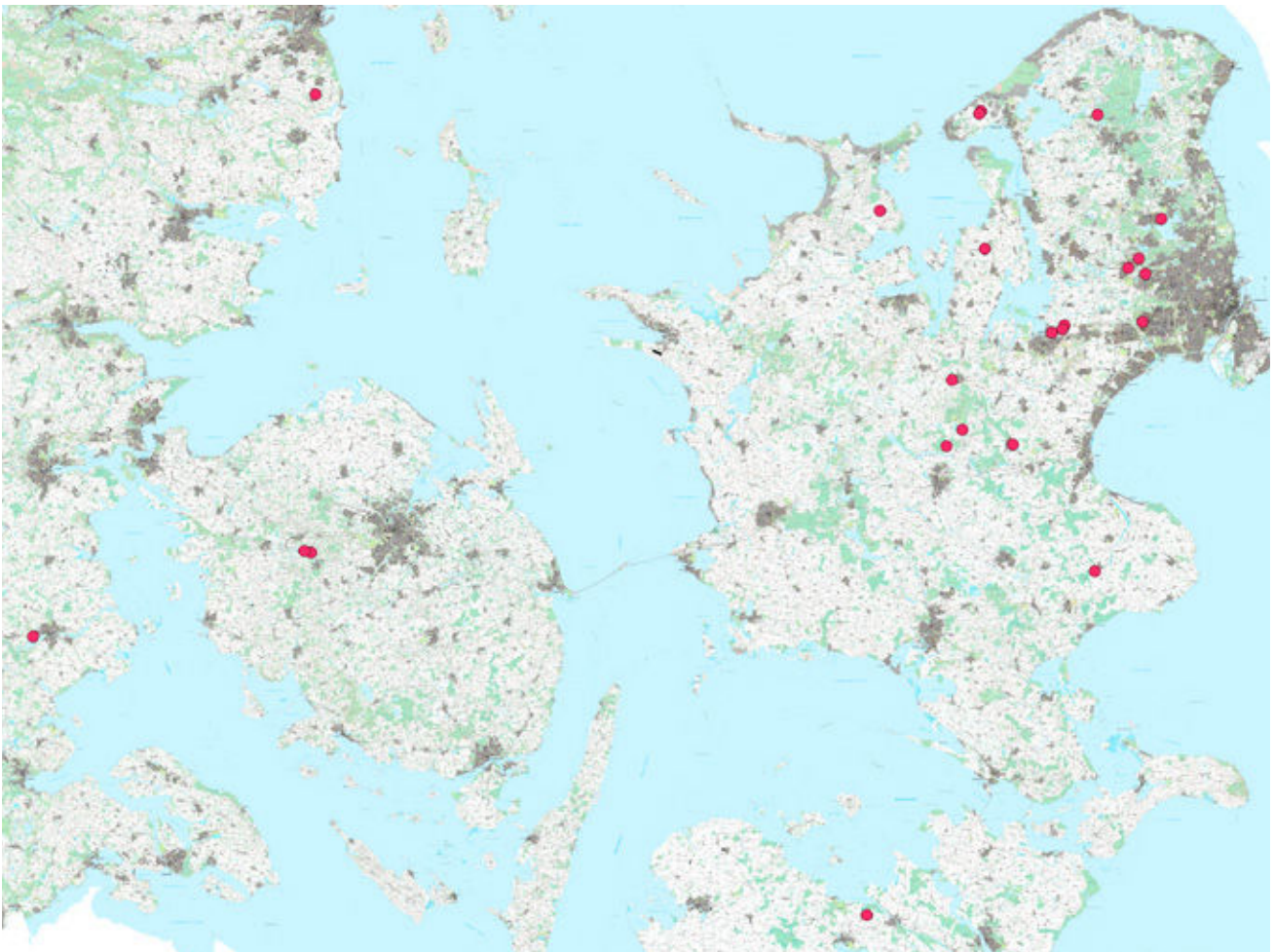
Her ses de 22 bofællesskaber, der var med i undersøgelsen.

Metoden tog afsæt i visuel etnografi, idet kvalitative interviews, fokusgruppeinterviews, deltagelse i møder, fester, madlavning, overnatning, kurser og udviklingsdage i bofællesskaberne blev kombineret med fotografering og visuelle metoder. Jeg blev vist rundt i omgivelserne, gik i landskabet, fotograferede og lavede walk-and-talk interviews. I alt blev 53 personer interviewet, hvoraf syv personer var professionelle aktører. De blev spurgt om deres baggrund og motivation for at deltage i etableringen af et bofællesskab, herunder hvordan bofællesskabet er organiseret og deres oplevelser med at flytte i/bo i bofællesskab og flytte fra by til land.