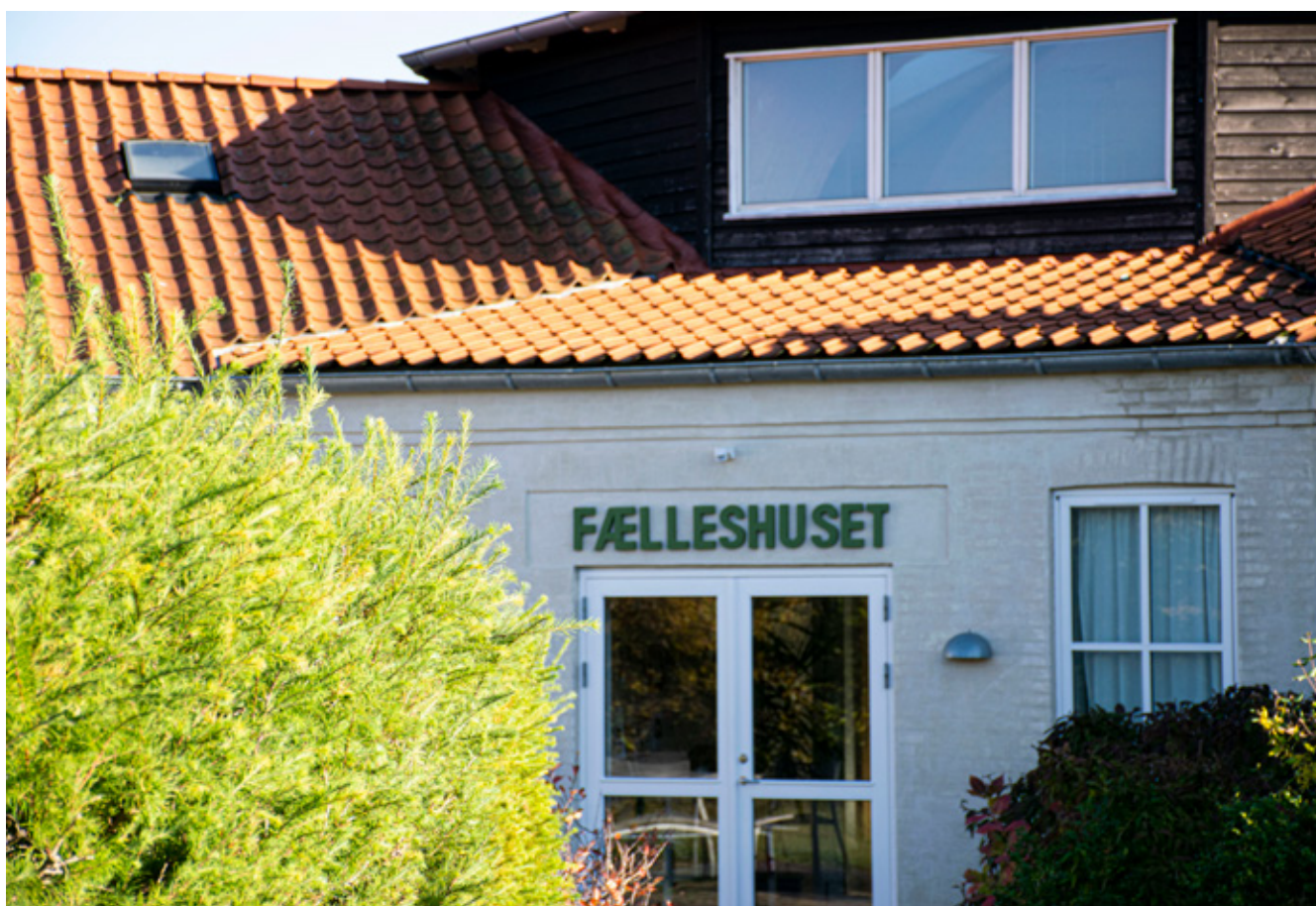
Fælleshuset i Økosamfundet Dyssekilde.