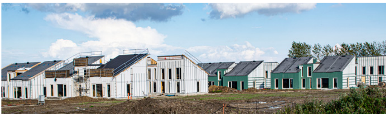
Karise Permatopia i byggefasen