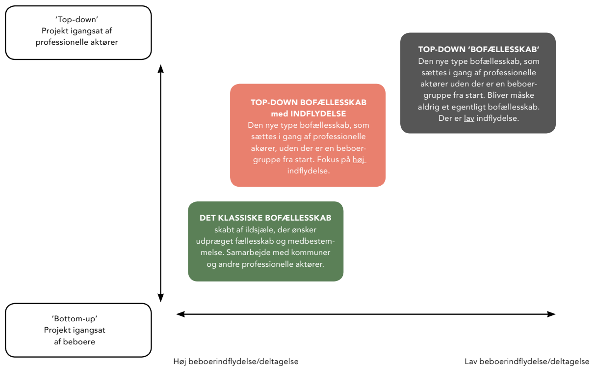
Figuren viser forskellen på graden af beboerinvolvering kombineret med en bottom-up og top-down balance, hvor det er ønskværdigt i en top-down facilitering, at bofællesskabet bliver etableret som i den rødlige boble, og ikke som i den sorte, hvor man risikerer at fællesskabet aldrig rigtig kommer til at fungere.

På fællesmøder diskuterer man, hvordan man løser forskellige udfordringer. Horizontal struktur og medbestemmelse er fast del af bofællesskabsformen med fællesmøder, madordning, arbejdsgrupper, arbejdsdage, og udviklingsdage. Man hjælper hinanden i hverdagen gennem fællesskabets ordninger og beslutningsprocesser.